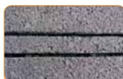
Snel & schoon in één bewerking: